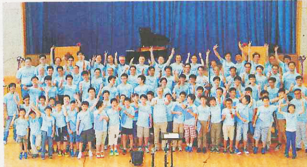
部分歌曲在聖保羅書院小學錄音。