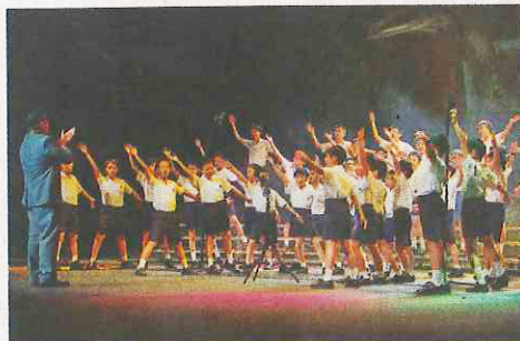
聖保羅書院小學每年有不少機會讓學生演出。