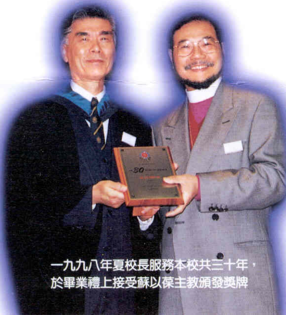
一九九八年夏校長服務本校共三十年，於畢業禮上接受蘇以葆主教頒發獎牌

另外，應社會因素的改變，家長對學校的態度漸趨兩極化。香港是一個經濟蓬勃的社會，但是在繁榮的背後往往都要付上代價。在商業競爭環境下求存，有部份家長往往因為要專注在事業上的發展而無