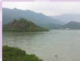
一百三十隻黑臉皮鷺 加一百五十隻白臉皮鷺