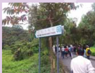
香港翠亨村(即上担水坑村)