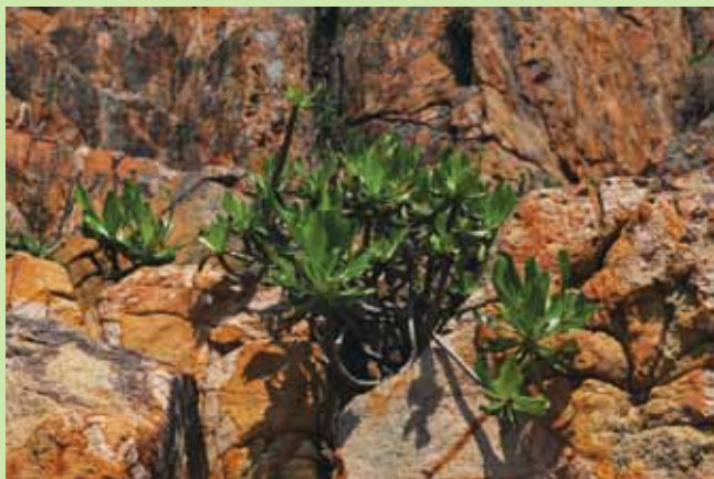
亞軍作品：石縫中的生命

在這裡，就像桃花源記中「山有小口，彷彿若有光」和「初極狹，纔通人；復行數十步，豁然開朗。」這自然遺產有如世外桃源、人間仙境！