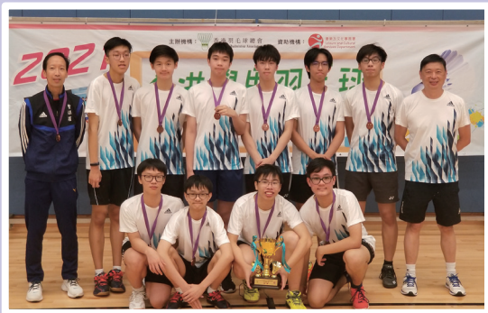
我校的羽毛球剛於6月14日奪得「2021年全港學界羽毛球團體錦標賽（公開組）季軍」

疫情之下，過去一年多同學們除了需要斷斷續續地回校上課和網上學習外，其實我們的運動隊伍面對的問題更加無助，不論泳隊、田徑隊、足籃羽乒手網等球類訓練，甚至乎保齡球、射箭隊都無一倖免要停止練習。