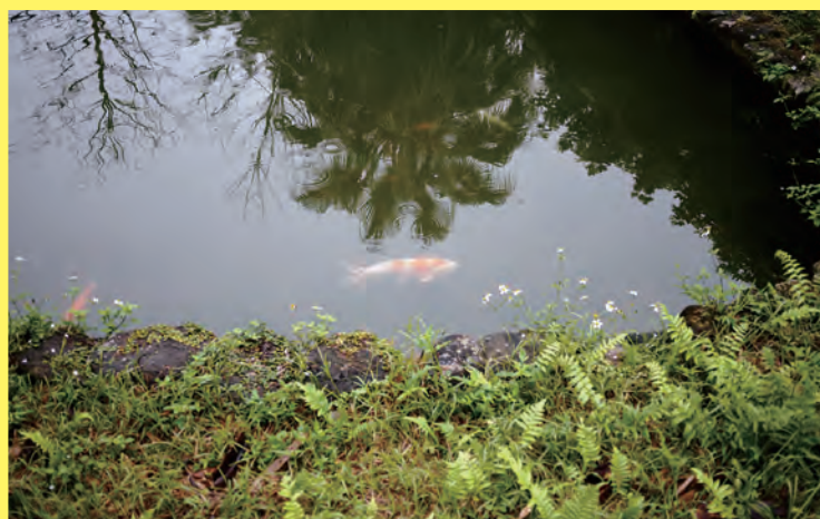
簡介：攝於獅子會自然教育徑，當時下著小雨，池中的錦鯉悠然自在。