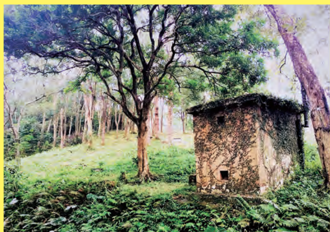
3D 學生 崔文誌 家長 陳寶儀