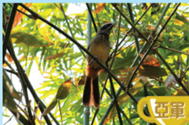
鳥兒在樹上靜止的一刻 2D 霍卓銘