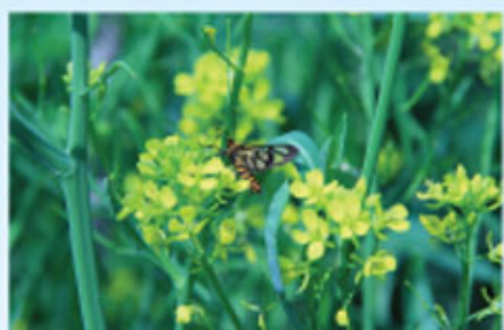
勤勞的蜜蜂 1E 鄭曉陽 優異獎