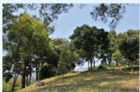
無題 2C 朱澤鋒 優異獎