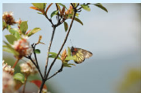
無題 1D 呂崇澤 優異獎