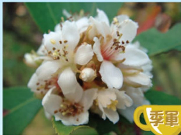
亂中有序 4F 李錦軒