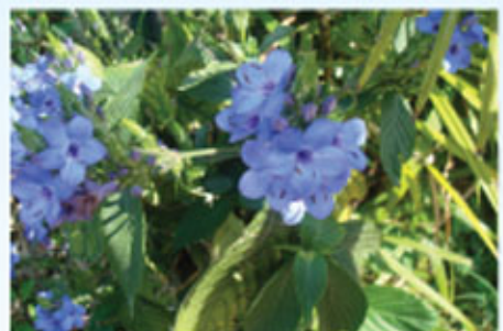
blue flowers 1E 老源豐 優異獎